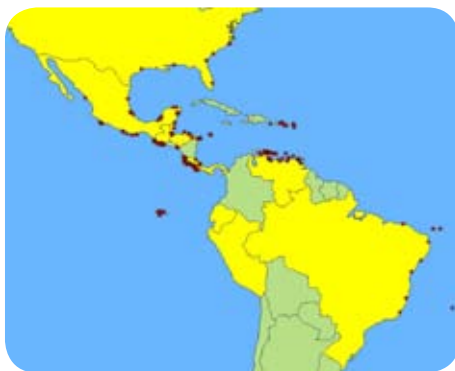
Sitios de importancia para la conservación de las tortugas marinas (Países Partes de la CIT).

De las seis especies, tres de ellas, Dermochelys coriacea , Eretmochelys imbricata y Lepidochelys kempii se encuentran en peligro crítico de extinción, es decir que ellas están enfrentando a un riesgo extremadamente alto de desaparecer.