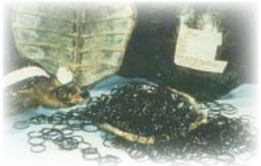
Productos elaborados con escamas del caparazón de carey.

Por otro lado, la temperatura de la arena determina el sexo que tendrán las tortugas (en general, las temperaturas altas producen hembras, mientras que las más bajas producen machos). En algunos casos, las construcciones altas o la destrucción de la vegetación hacen que varíe la temperatura de la arena, lo cual puede alterar la distribución de los sexos. También los efectos del cambio climático mundial podrían estar afectando a las tortugas marinas; sus consecuencias pueden ser desde un cambio en la temperatura de la arena hasta un aumento en el nivel de erosión.