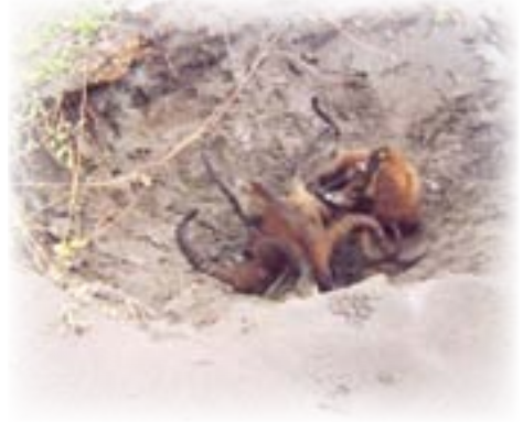
Sobrevivir a la depredación es cada vez más difícil para las tortugas marinas